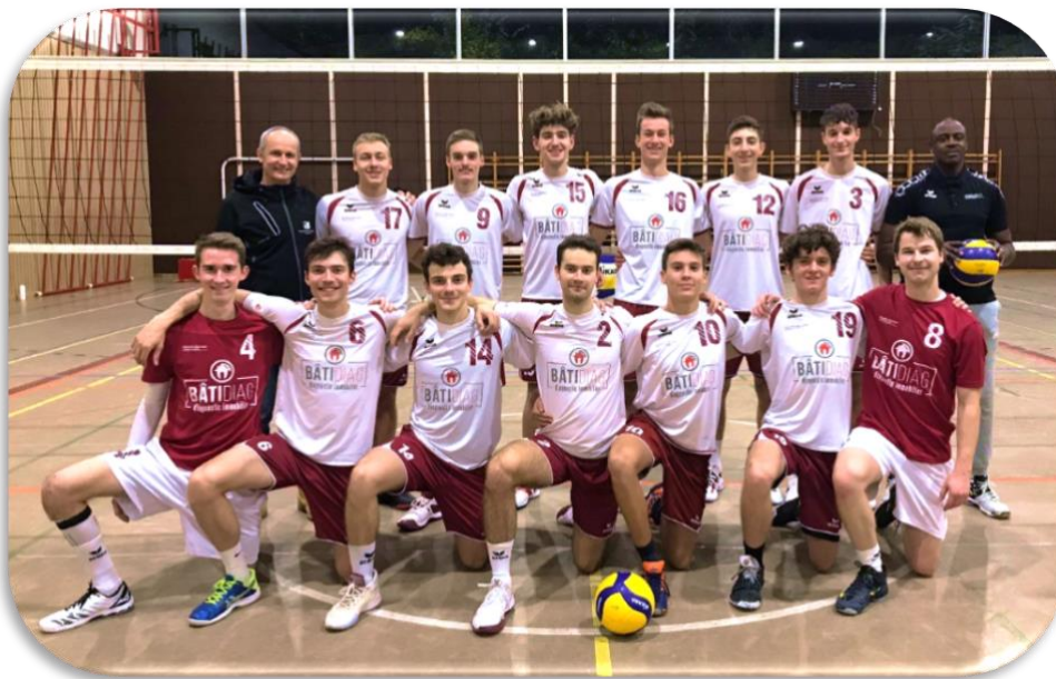
1 ère ligue de Servette Star-Onex

La première ligue masculine de Servette Star-Onex a terminé au 1 er rang de son groupe lors du tour de qualification, le championnat a été interrompu par la suite lors des playoffs.