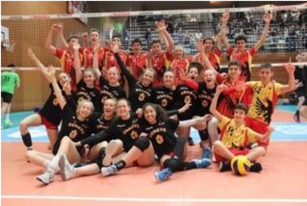
U17 filles et garçons Genève Relève Vice-champions suisses