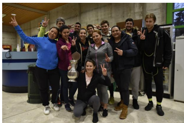
Vainqueurs catégorie mixte PVI