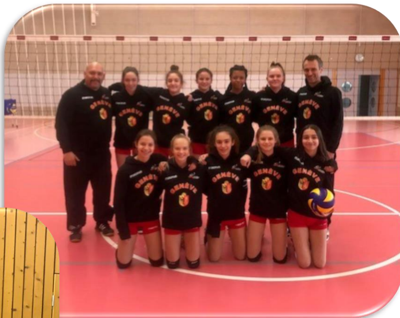
U15F Genève Relève 3 ème au Championnat suisse