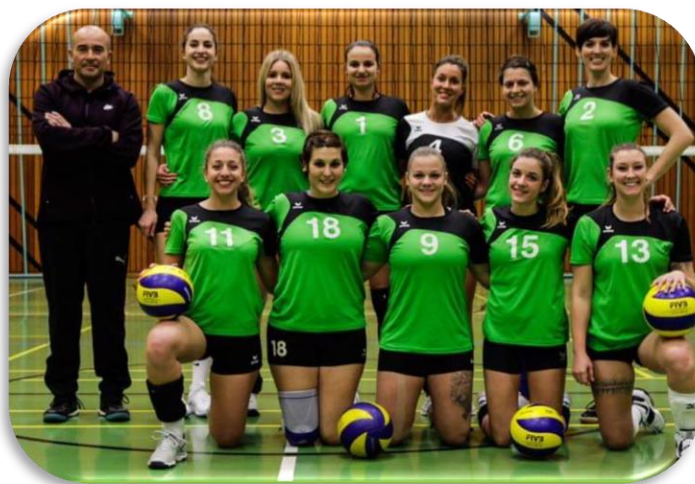
2 ème ligue de Meyrin promue en 1 ère ligue