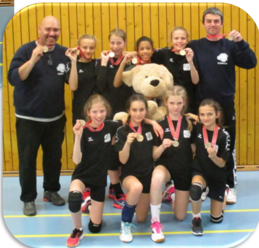
U13F Ferney 3 ème au Championnat suisse