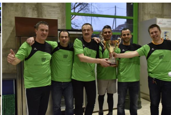
Vainqueurs catégorie masculine Union Bancaire Privée

La 21 e édition du tournoi corporatif devrait avoir lieu le dernier dimanche de janvier 2020