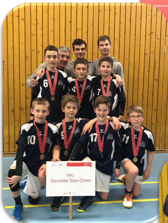
U13M SSO 3 ème au Championnat suisse